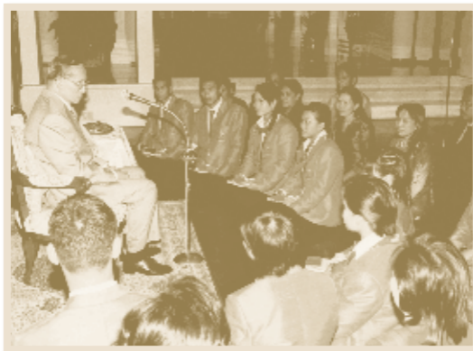
เสด็จฯ ลง ณ ท้องพระโรงศาลาเริง ว่างไกลกังวล จังหวัดประจวบคีรีขันธ์ พระราชทานพระบรมราชวโรกาสให้นักกีฬาโอลิมปิก เข้าเฝ้าฯ เมื่อวันที่ ๙ กันยายน พุทธศักราช ๒๕๔๗