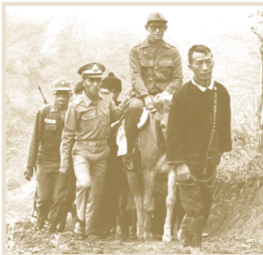
เสด็จพระราชดำเนินไปทรงเยี่ยมชาวไทยภูเขา