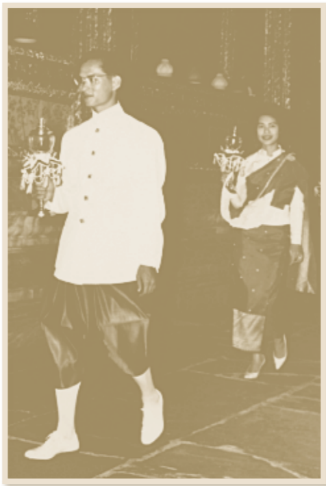
ทรงเวียนเทียน เนื่องในวันวิสาขบูชา ณ วัดพระศรีรัตนศาสดาราม