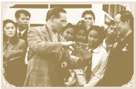
ทรงสอนนักเรียนวังไกลกังวล