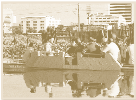
เสด็จพระราชดำเนินไปทอดพระเนตรความก้าวหน้าโครงการบึงมวกะสัน เมื่อวันที่ ๘ มิถุนายน พุทธศักราช ๒๕๓๐