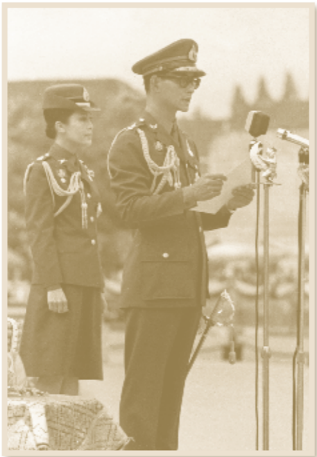
พระราชทานพระบรมราโชวาท ในการสวนสนามแสดงแสนยานุภาพ ของกองทัพไทย เนื่องในพระราชพิธีรัชมังคลาภิเษก วันที่ ๘ มิถุนายน ๒๕๑๔